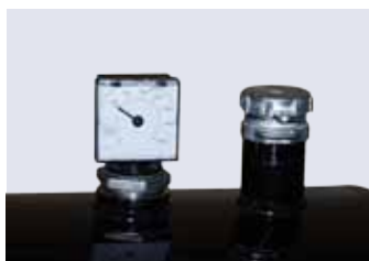
Måleur og påfyldningsstuds